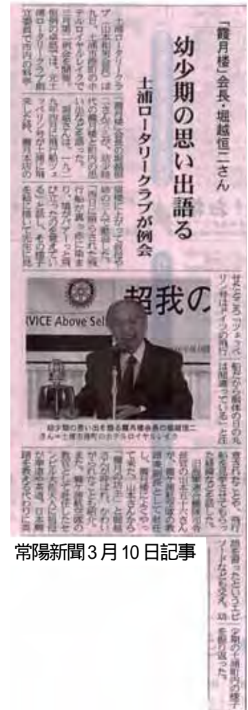
常陽新聞3月10日記事