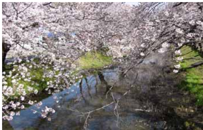
新しい時季・桜色～新川の春もよう～

RI（国際ロータリー）の創立：1905（明治38） 日本のロータリー創立：1920（大正9）