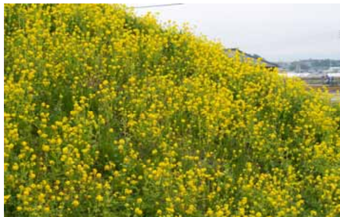
菜の花が咲いていた ~ウォーキングコースにて~