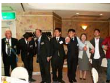
手に手つないで輪になって歌おう！