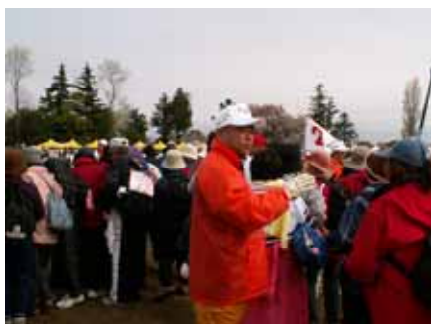
ゴール前でお出迎え