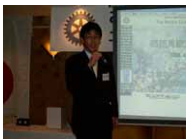
RACの話聞いて下さい