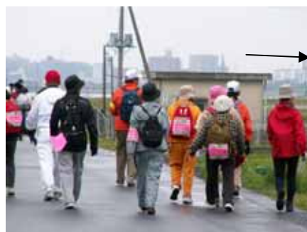
マラソン頑張ってるなあ