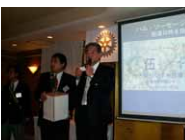
誰に当たるか？(中央のかわいい二人は山上兄妹)