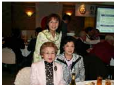
いつも素敵な奥様たち