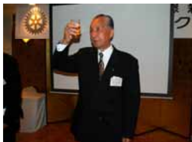
神林会員の音頭で乾杯