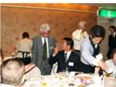
語れば楽し・・・