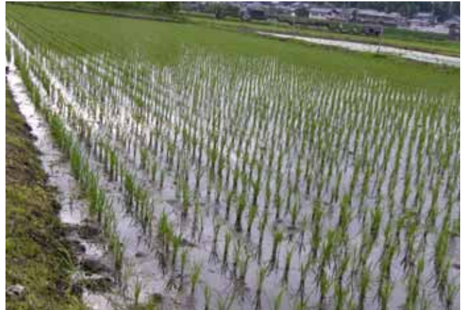
秋の実りに願いを込めて

RI（国際ロータリー）の創立：1905（明治38） 日本のロータリー創立：1920（大正9）