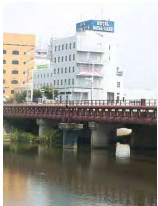
例会場：ホテルロイヤルレイク土浦

8/11 「会員増強及び拡大月間に因んで」 会員増強委員会 8/18 クラブフォーラム