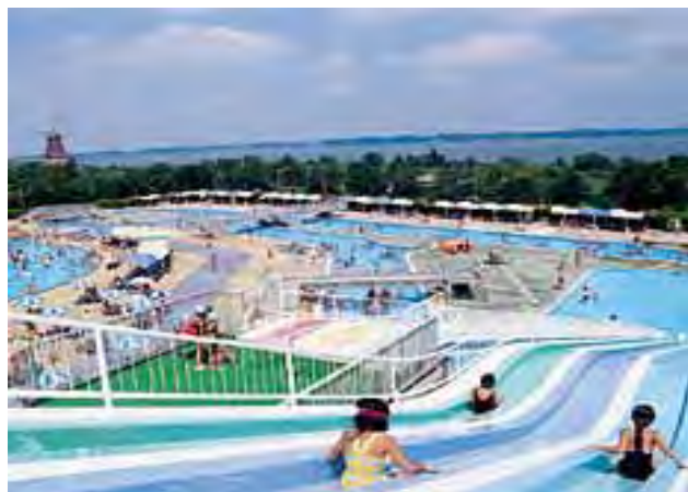
夏真っ盛りの水郷プール

RI（国際ロータリー）の創立：1905（明治38） 日本のロータリー創立：1920（大正9）