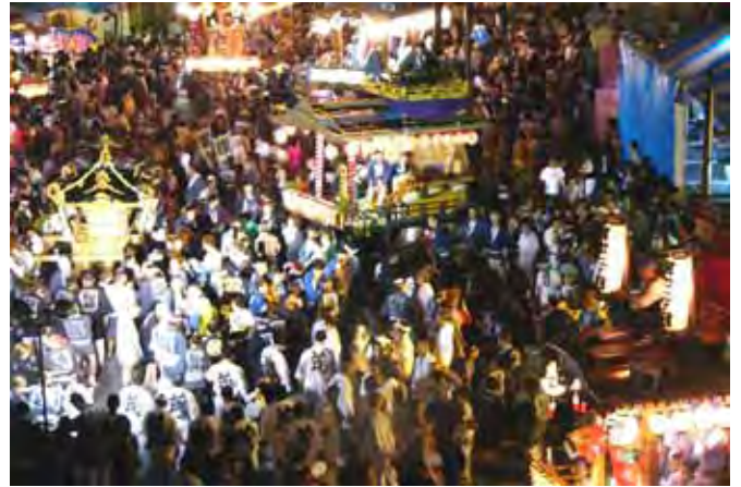
キララまつりで汗キラキラ