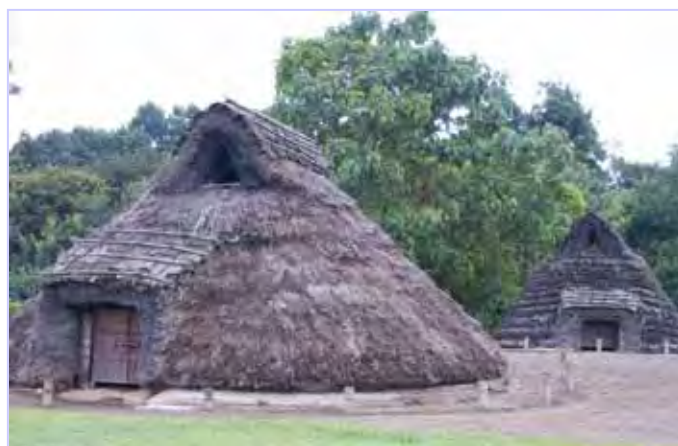
いにしえを想ふ～上高津貝塚にて～

RI（国際ロータリー）の創立：1905（明治38） 日本のロータリー創立：1920（大正9）