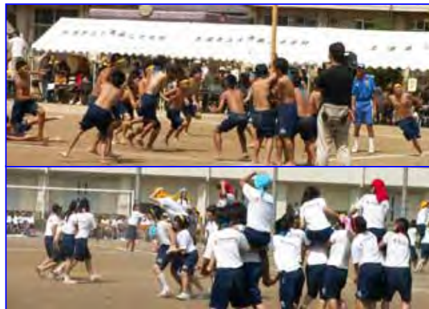
“新・新世代の力” 運動会シーズン