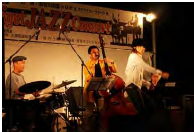
中秋のムーンライトセレナーデ サウンド蔵2005より