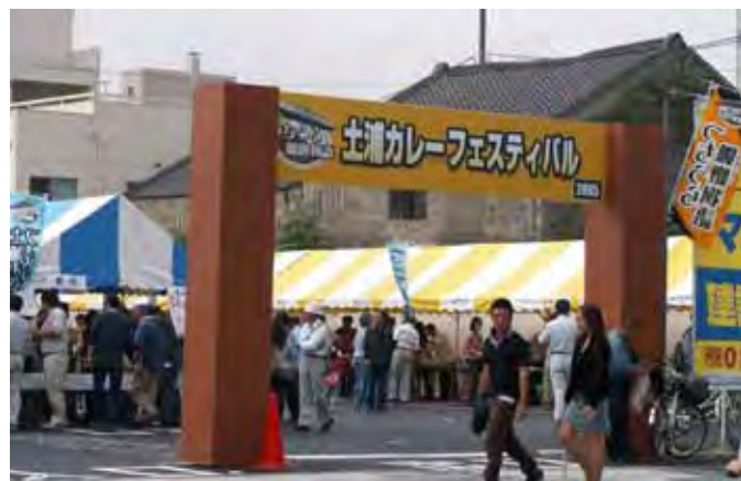
第29回土浦市産業祭・土浦カレーフェスティバル