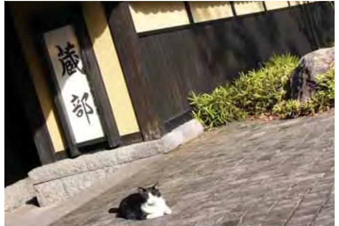
小布施の陽だまり

RI (国際ロータリー) の創立：1905 (明治 38) 日本のロータリー創立：1920 (大正 9)