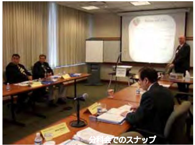
分科会でのスナック

窓からはシカゴの街が遠望でき、目の前はノース・ウエスタン大学、広大なミシガン湖が一望であります。また、ビルの中にはユニティビル 711 号室 (1905 年 2 月 23 日、初めてロータリーの会合が開かれた 4 人のロータリアンの 1 人鉦山技師ガスターバス・ローワの事務所を復元したもの) があり、現在のシカゴ市庁舎の向かい側にそのビルがあったとのことでした。また、ポール・ハリスの当時の部屋も再現されていました。まさに「百聞は一見に如かず」です。この会議に参加させて頂き、各国のロータリアンと親睦を分かち合い、会議を通じて多くのことを学びました。この貴重な経験を生かし、これからのクラブ運営に少しでもお役に立てればと考えております。ご静聴有難うございました。