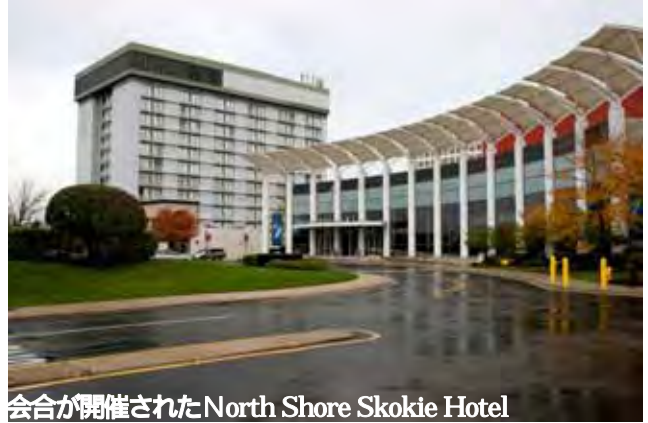
会議が開催されたNorth Shore Skokie Hotel

シカゴ郊外の住宅地を30分くらいでホテルに到着しました。スコークー村は面積10平方キロ、人口64,000人でホテルの目の前は、ウエストフィールド・ショッピングタウンと言う広大な施設があり、駐車場も十二分に用意されていました。ここでは車がないと住めない実感しました。