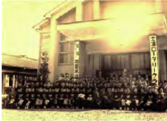
土浦RCチャーターナイト(1958年10月10日)