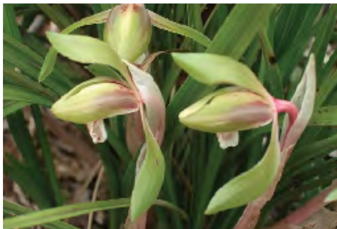
一足早く芽生えたシュラン

RI（国際ロータリー）の創立：1905（明治38） 日本のロータリー創立：1920（大正 9）