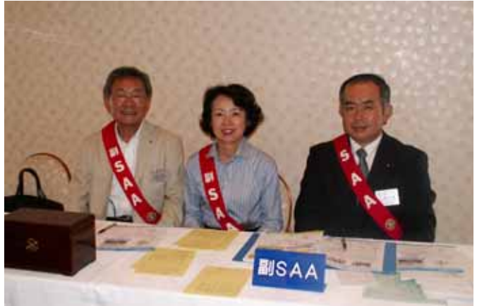
「今年も、格調高く、和やかに」

RI（国際ロータリー）の創立：1905（明治 38） 日本のロータリー創立：1920（大正 9）