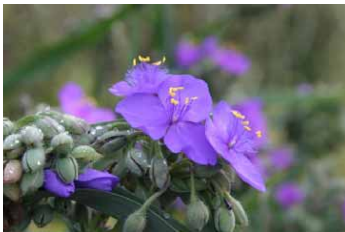
ムラサキツユクサ

RI（国際ロータリー）の創立：1905（明治38） 日本のロータリー創立：1920（大正9）