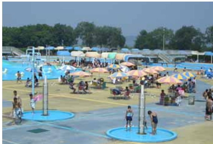
夏真っ盛り 水郷プール

RI（国際ロータリー）の創立：1905（明治 38） 日本のロータリー創立：1920（大正 9）