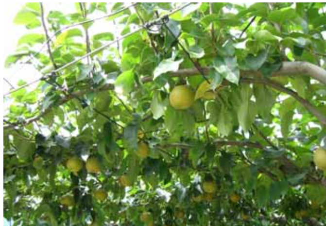
盛夏の中 実りを迎えて

RI（国際ロータリー）の創立：1905（明治38） 日本のロータリー創立：1920（大正9）