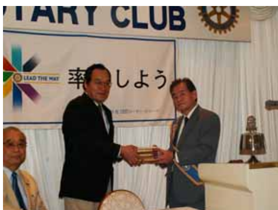
図書「俗文学叢刊」100冊