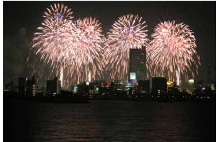
第75回土浦全国花火競技大会

RI（国際ロータリー）の創立：1905（明治38） 日本のロータリー創立：1920（大正9）