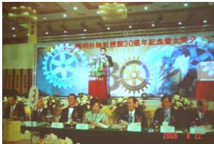
「台北陽明R C 30周年記念式典」

RI（国際ロータリー）の創立：1905（明治 38） 日本のロータリー創立：1920（大正 9）