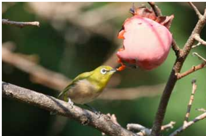
「秋深し・・・」

RI（国際ロータリー）の創立：1905（明治 38） 日本のロータリー創立：1920（大正 9）