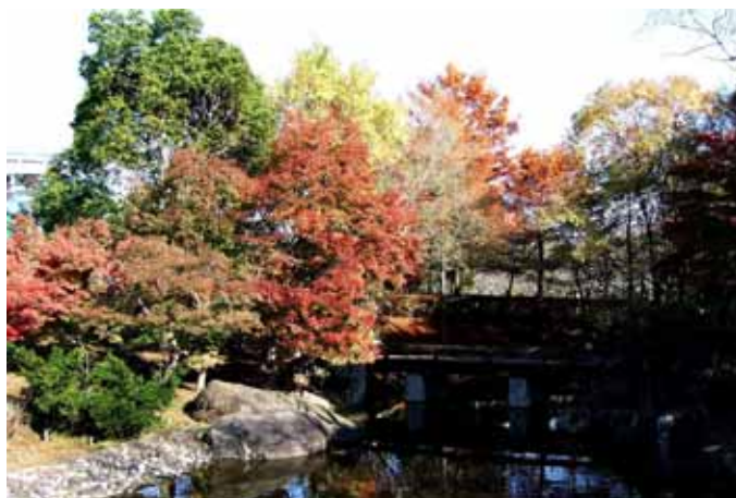
「晩秋の彩(霞ヶ浦総合公園にて)」

RI (国際ロータリー) の創立：1905 (明治 38) 日本のロータリー創立：1920 (大正 9)