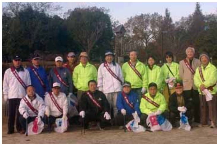
「霞ヶ浦総合公園清掃」

RI（国際ロータリー）の創立：1905（明治 38） 日本のロータリー創立：1920（大正 9）