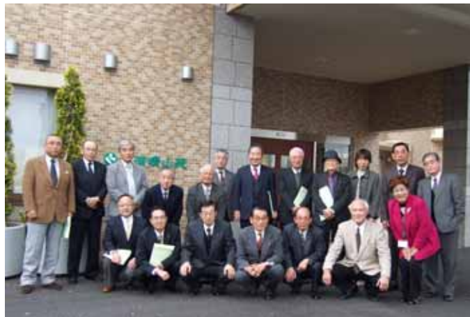
「特別養護老人ホーム 土浦晴山苑前にて」

RI（国際ロータリー）の創立：1905（明治38） 日本のロータリー創立：1920（大正9）