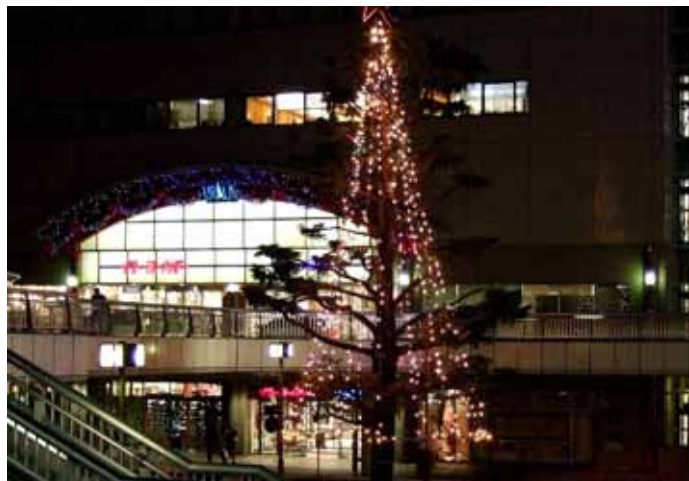
「土浦駅前ひろばクリスマスツリー」

RI（国際ロータリー）の創立：1905（明治38） 日本のロータリー創立：1920（大正9）