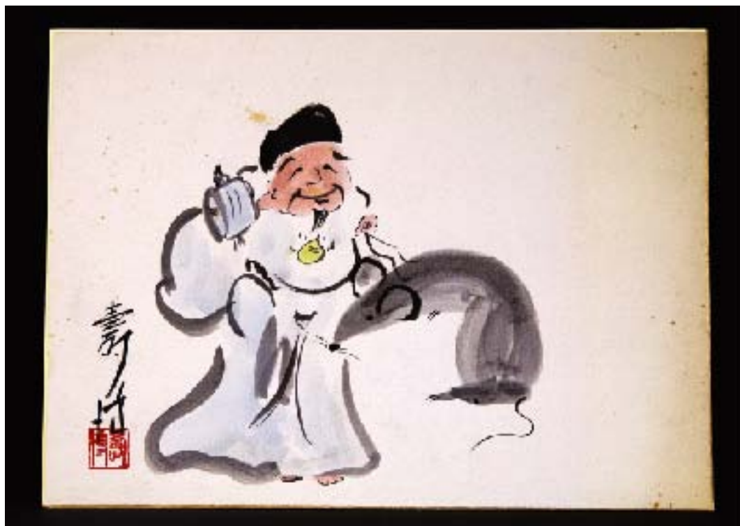
井上壽博ガバナー作