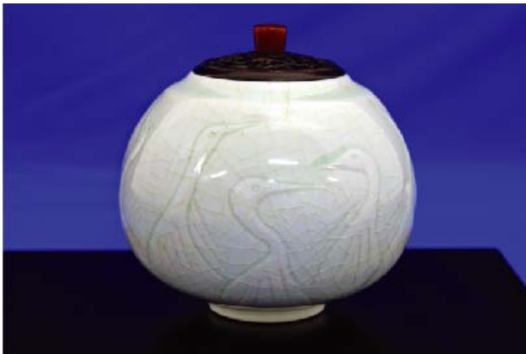
井上壽博ガバナー作