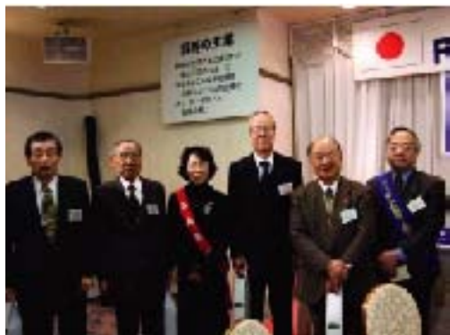
誕生祝・結婚祝(1月)の方々