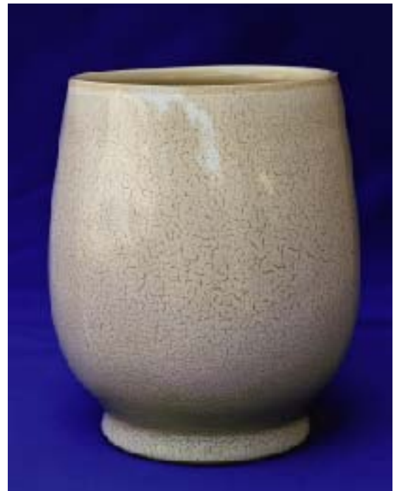
井上壽博ガバナー作