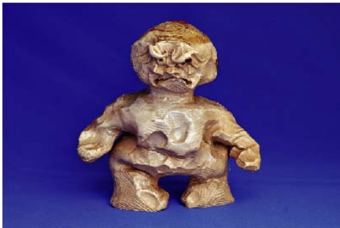
井上壽博ガバナー作