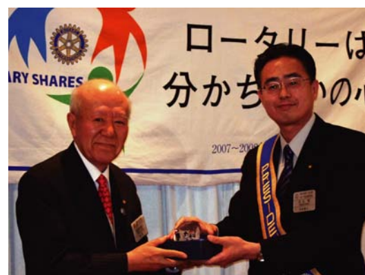
ロータリー財団より大口寄付者の認証を受けている海老原会員