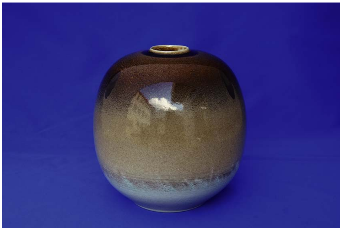
井上壽博ガバナー作