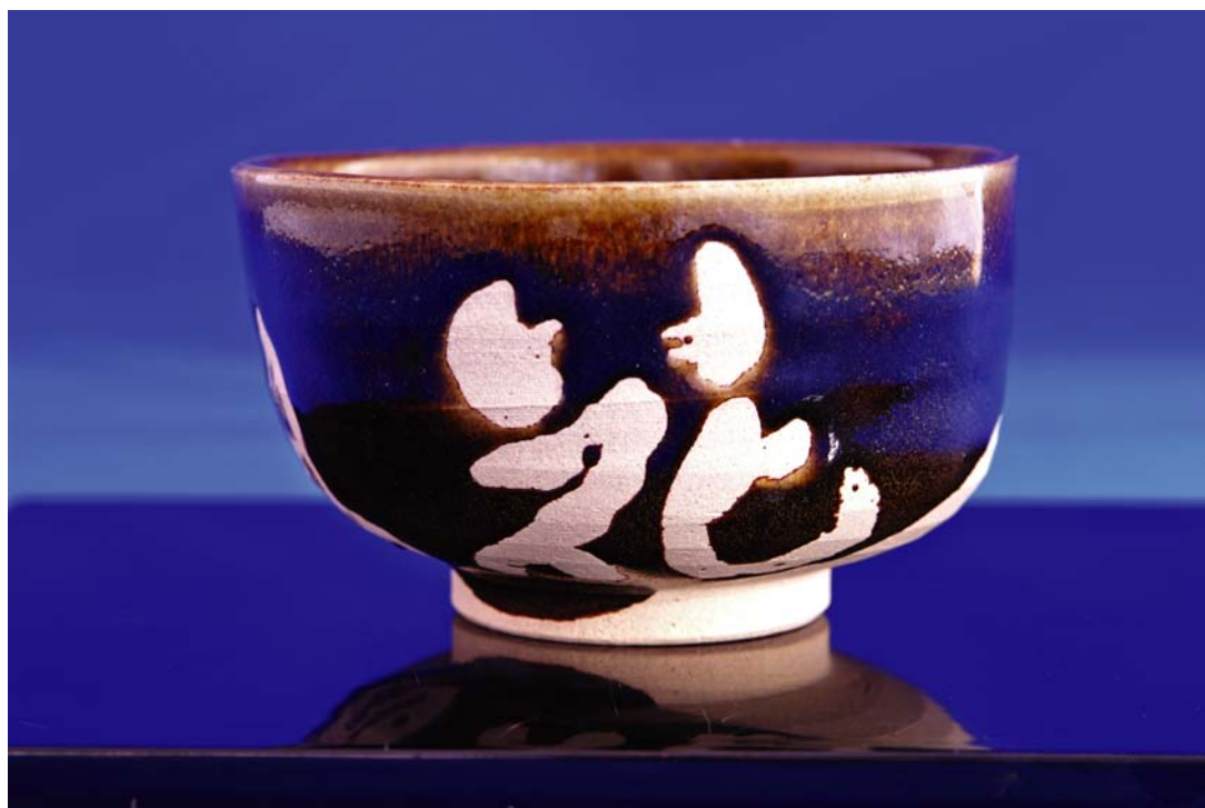
井上壽博ガバナー作