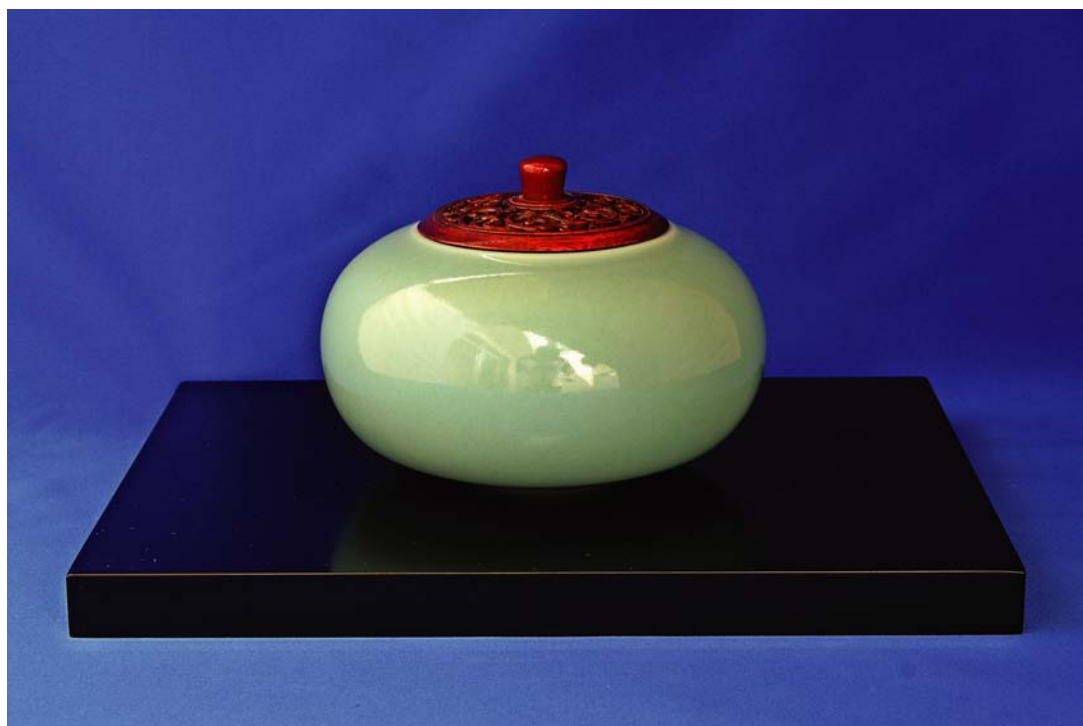
井上壽博ガバナー作