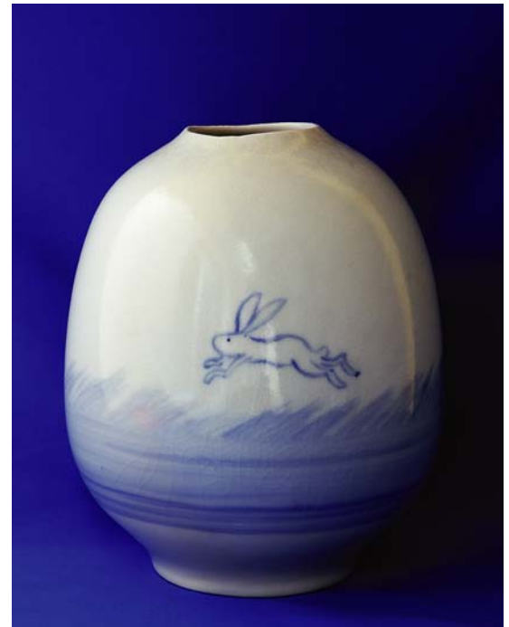
井上壽博ガバナー作