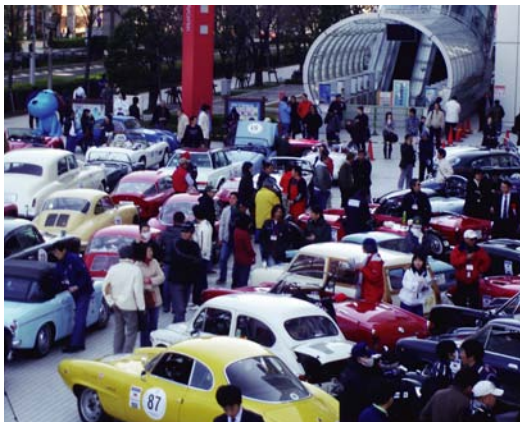
お台場 フジテレビ前