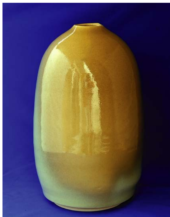
井上壽博ガバナー作