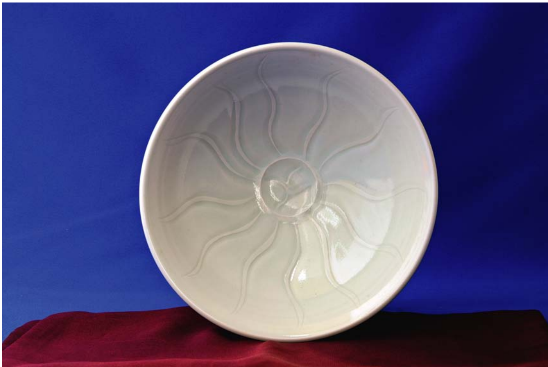
井上壽博ガバナー作