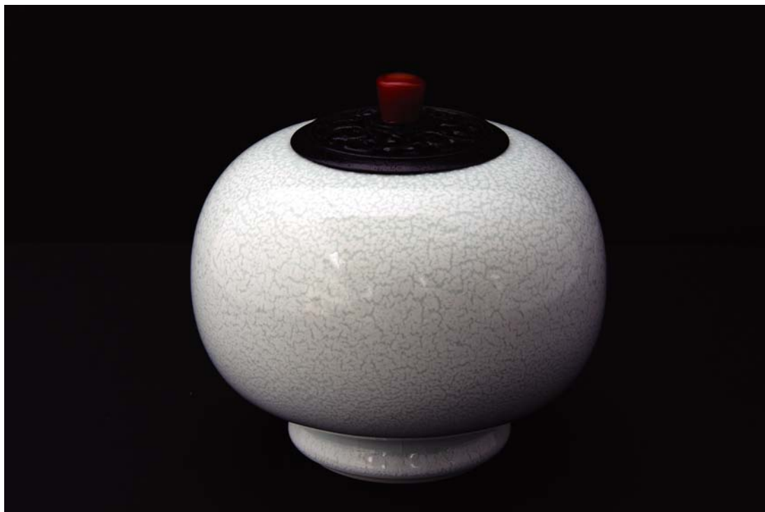
井上壽博ガバナー作