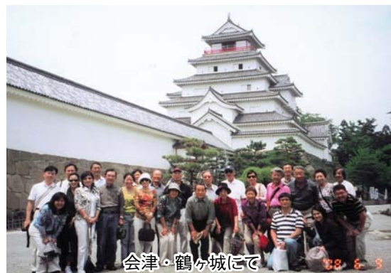
会津・鶴ヶ城にて