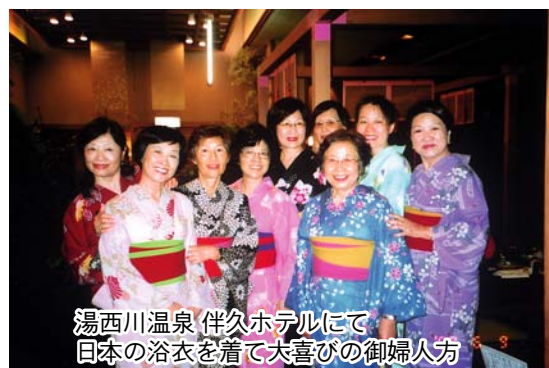
湯西川温泉 伴久ホテルにて 日本の浴衣を着て大喜びの御婦人方