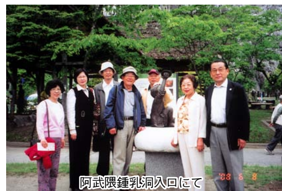
阿武隈鍾乳洞入回にて