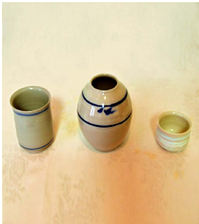
井上壽博ガバナー作