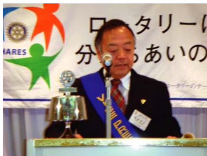
クラブ組織委員会 堀越委員長