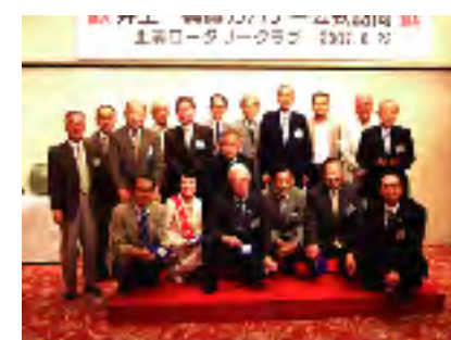
前年度会長・幹事に感謝状