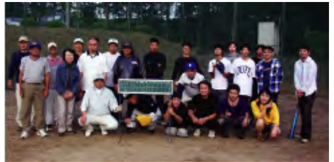
10/14 ソフトボール大会