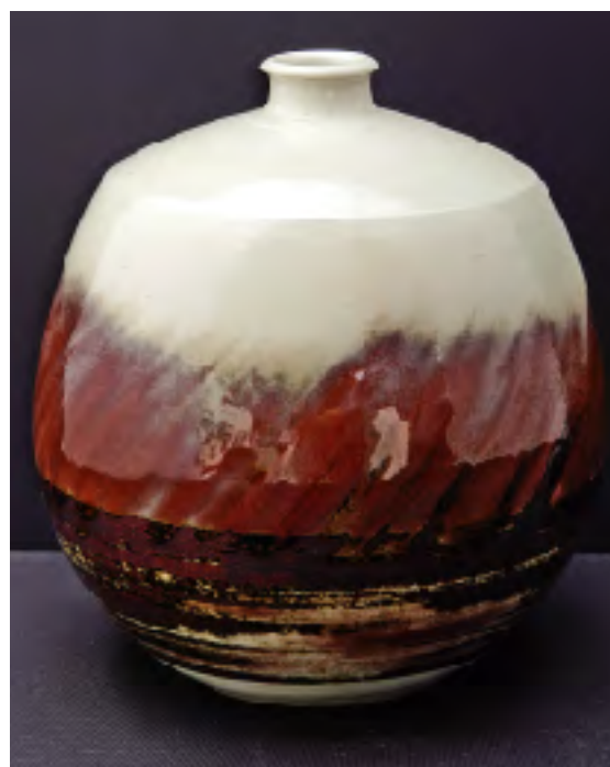
井上壽博ガバナー作