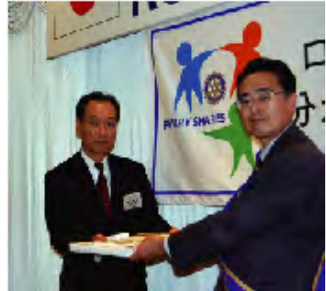
富田会員への会員証交付