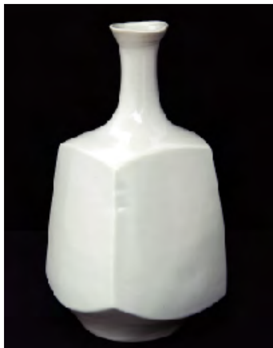
井上壽博ガバナー作