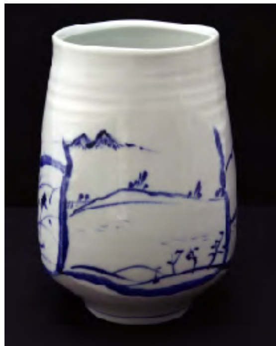
井上壽博ガバナー作