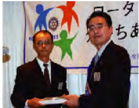
中山会員への会員証交付