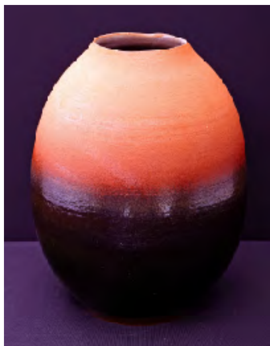
井上壽博ガバナー作