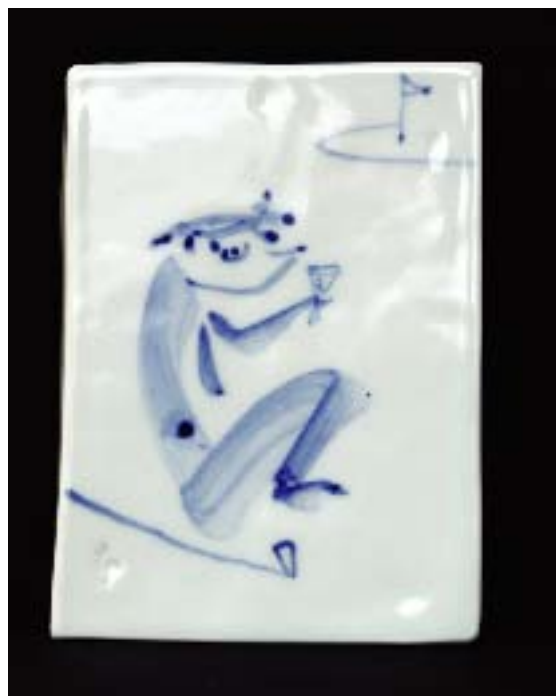
井上壽博ガバナー作