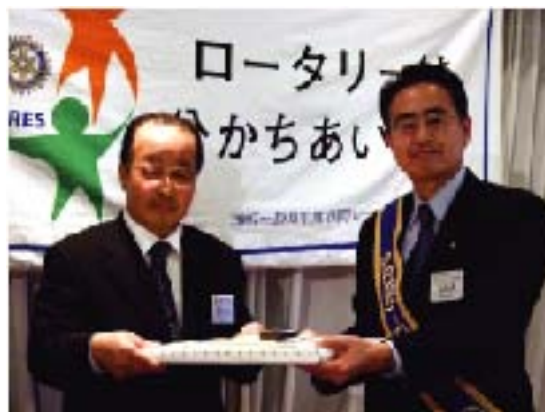
宮本会員への会員証交付