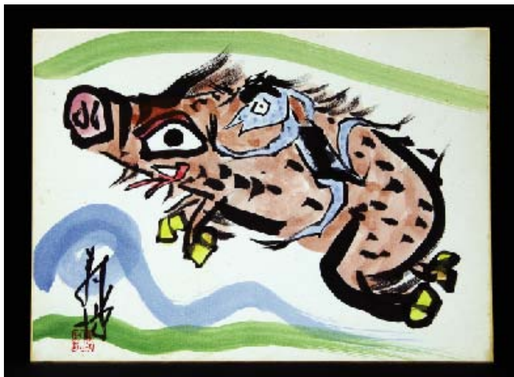
井上壽博ガバナー作